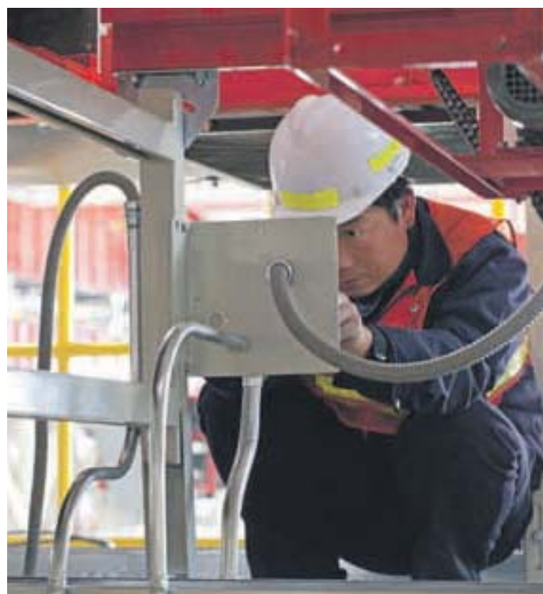
Los expertos prevén un aumento de las operaciones de compraventa